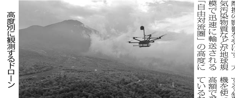
高度別に観測するドローン