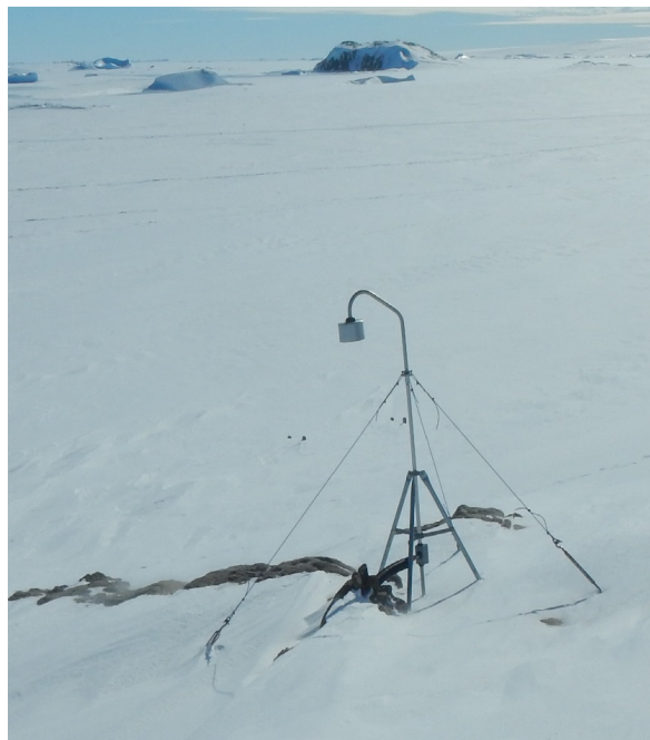
図2 昭和基地で屋外の電場を測定する機器 (フィールドミル回転集電器)

世界標準時の8時ごろに風速と雪粒の数が増し、地吹雪が観測されている。これに伴って、約2 kV/mの電場が観測された。